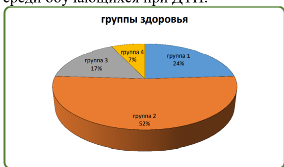
Рисунок 6. Уровень здоровья детей в 2020-2021 учебном году

Самая многочисленная группа здоровья – это 2 группа, в которой дети имеют функциональные отклонения в состоянии здоровья. Снизилось процентное соотношение детей, относящихся к 3 и 4 группам здоровья, а увеличилось процентное соотношение обучающихся 1 и 2 групп здоровья. Структура хронических заболеваний у школьников совпадает со структурой функциональных отклонений. В целях сохранения и укрепления