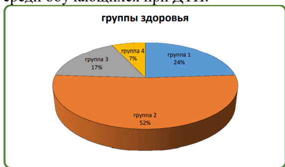
Рисунок 6. Уровень здоровья детей в 2020-2021 учебном году

Самая многочисленная группа здоровья – это 2 группа, в которой дети имеют функциональные отклонения в состоянии здоровья. Снизилось процентное соотношение